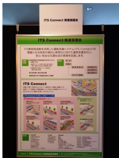
図1：本協議会の展示パネル